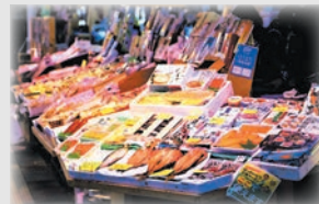
函館朝市 イメージ

ふれあいコーディネーター 旅行企画実施 株式会社 農協観光 山陰支店 ☎(0852)26-2600 〔担当：前田〕