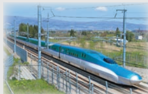
はやぶさ新幹線 イメージ