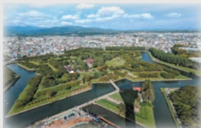
五稜郭タワーからの景色 イメージ