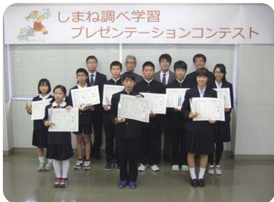
本選会に出場のみなさん

今後とも算数・数学を発展的に学ぼうとする意欲と感性豊かな児童生徒の皆さんがたくさん育つことを期待しています。