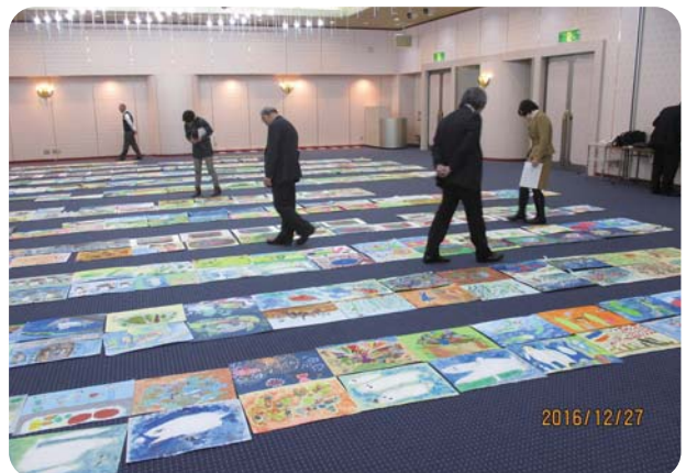
県内の教育関係者等の審査委員により審査しました。