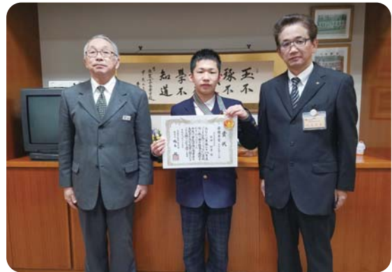
出雲北陵中学校における表彰の様子

「しまね調べ学習プレゼンテーションコンテスト」では、予選審査を経た小学校・中学校・高等学校それぞれ3名による本選会でのプレゼンテーションが行われました。発表者は自ら課題を設定し、それを解決するために、図書資料等を活用して資料を作成し、図表等を効果的に活用し、聞き手を意識しながら堂々と発表が行われました。