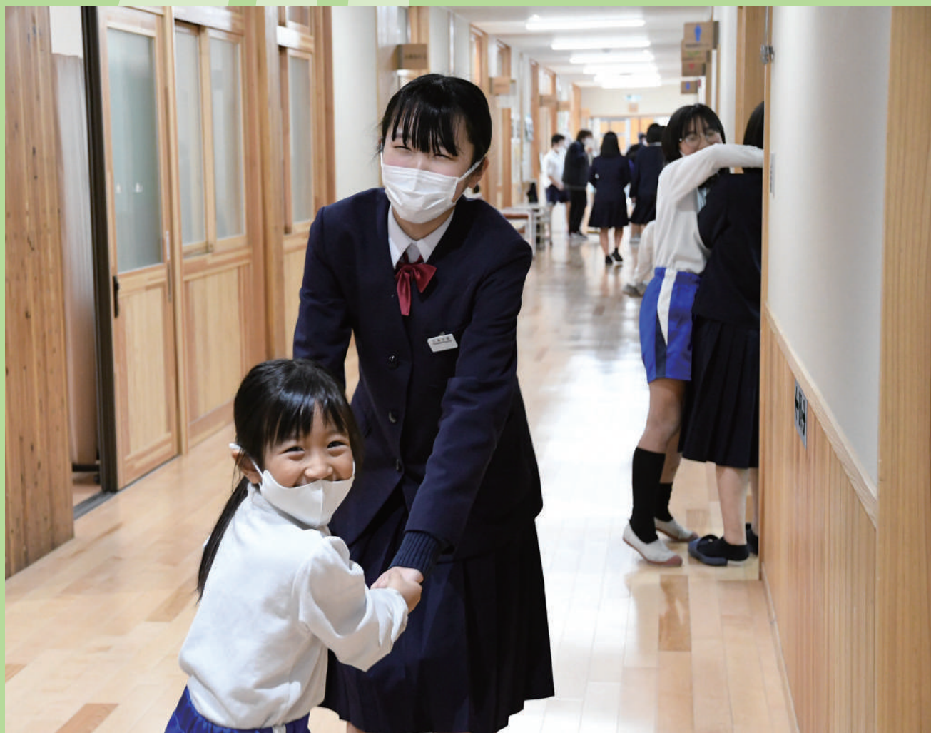
松江市立義務教育学校 玉湯学園