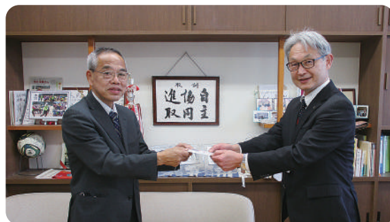
松江市立第一中学校での贈呈

今年度は、県内のすべての中学校、義務教育学校（後期課程）、特別支援学校に1校4万円、合計460万円分の図書カードを助成しました。